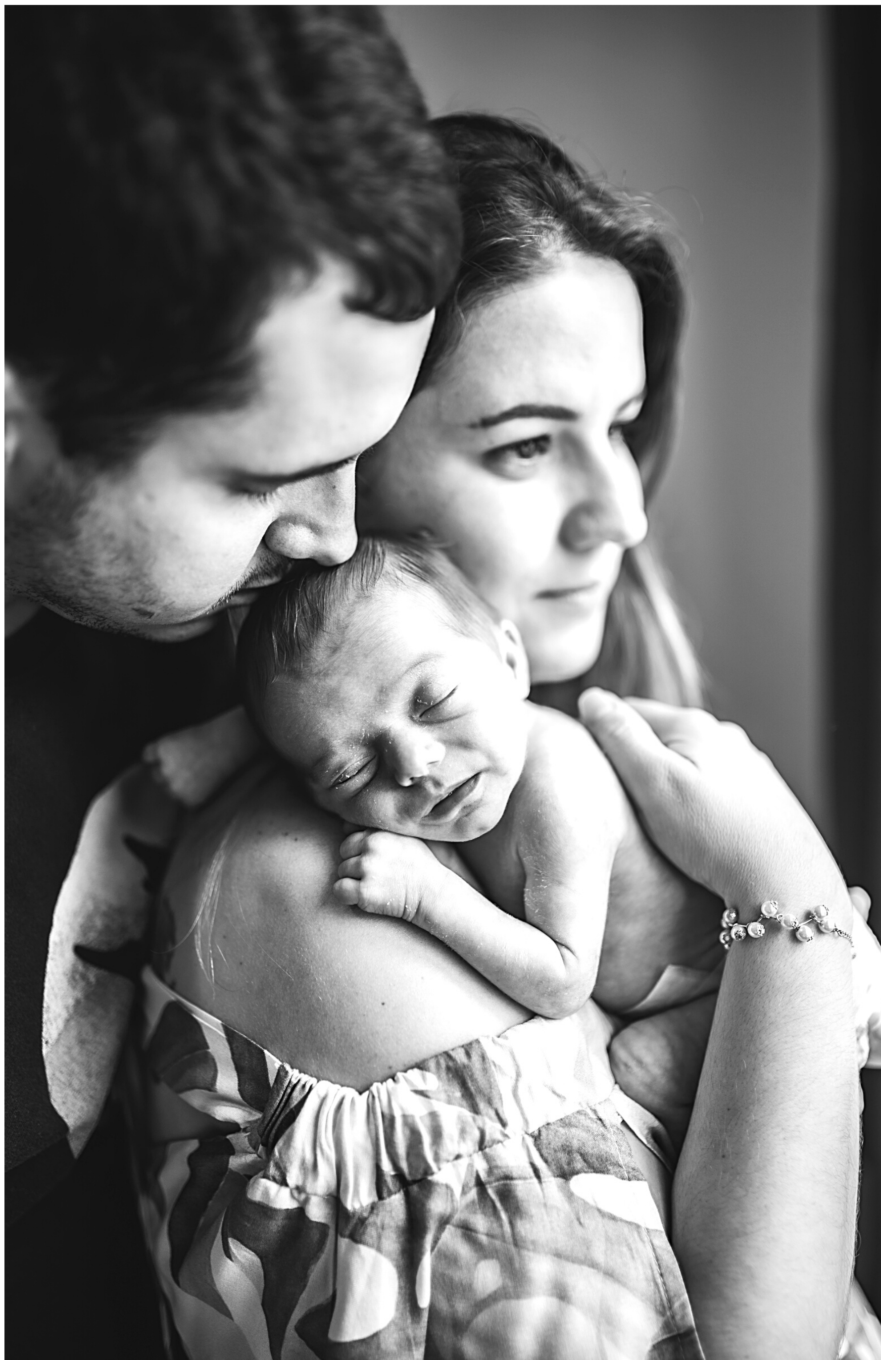
Foto bonita, pra mim, é foto que faz sentido. E fazer sentido é fazer SENTIR . Nostalgia, saudade, conforto, felicidade, alívio, plenitude. O que você sente hoje quando olha pro seu bebê? Caos, amor incondicional, medo, felicidade, cansaço, gratidão...?