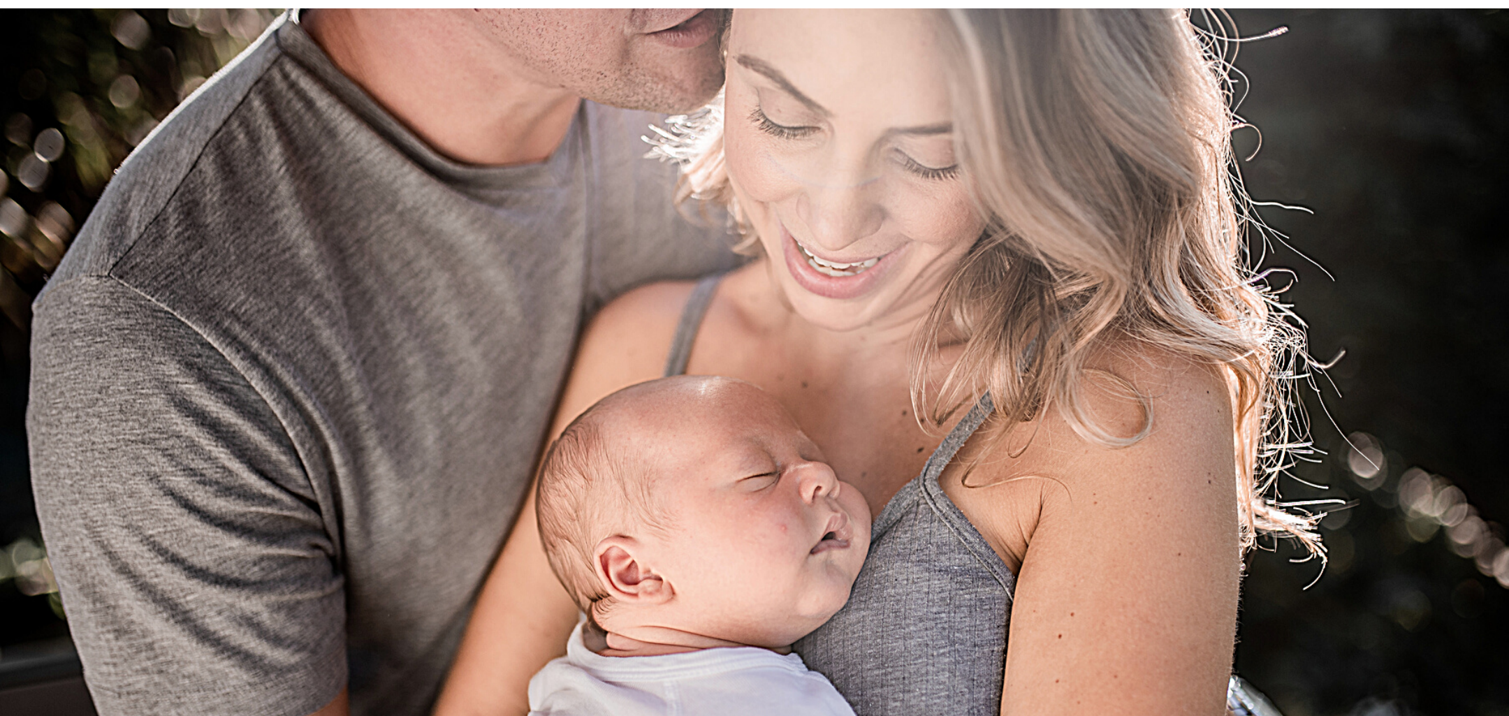
Foto boa é obrigação de todo fotógrafo profissional. Afinal, todos nós hoje temos um bom equipamento. Inclusive você, mãe. Você tem um celular que, muitas vezes faz fotos mais bonitas que muita câmera.